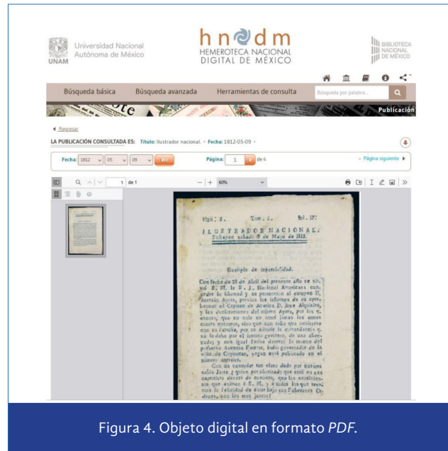
Figura 4. Objeto digital en formato PDF .

Así, la plataforma de distribución facilita que la Hemeroteca Nacional brinde acceso continuo y constante a los materiales digitalizados, independientemente de la ubicación geográfica de los usuarios, además de ofrecer continuamente nuevos títulos digitalizados de publicaciones impresas que son de gran valor y utilidad para investigadores y para el público en general. En la figura 3, “Nuevas publica-